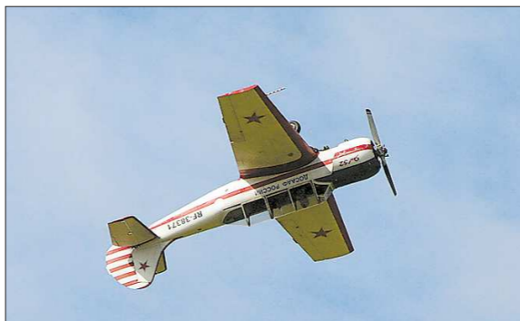
Модель самолёта ЯК выполняет фигуру пилотажа «Бочка»